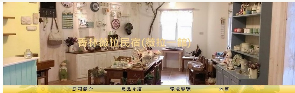
香林薇拉民宿(薇拉一館)

網址： http://trade.1111.com.tw/web/vivilla